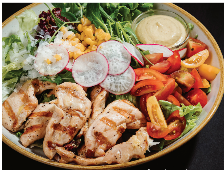
Cezarjeva solata s piščancem

sezonska mešana zelena solata, koruza, paradižnik