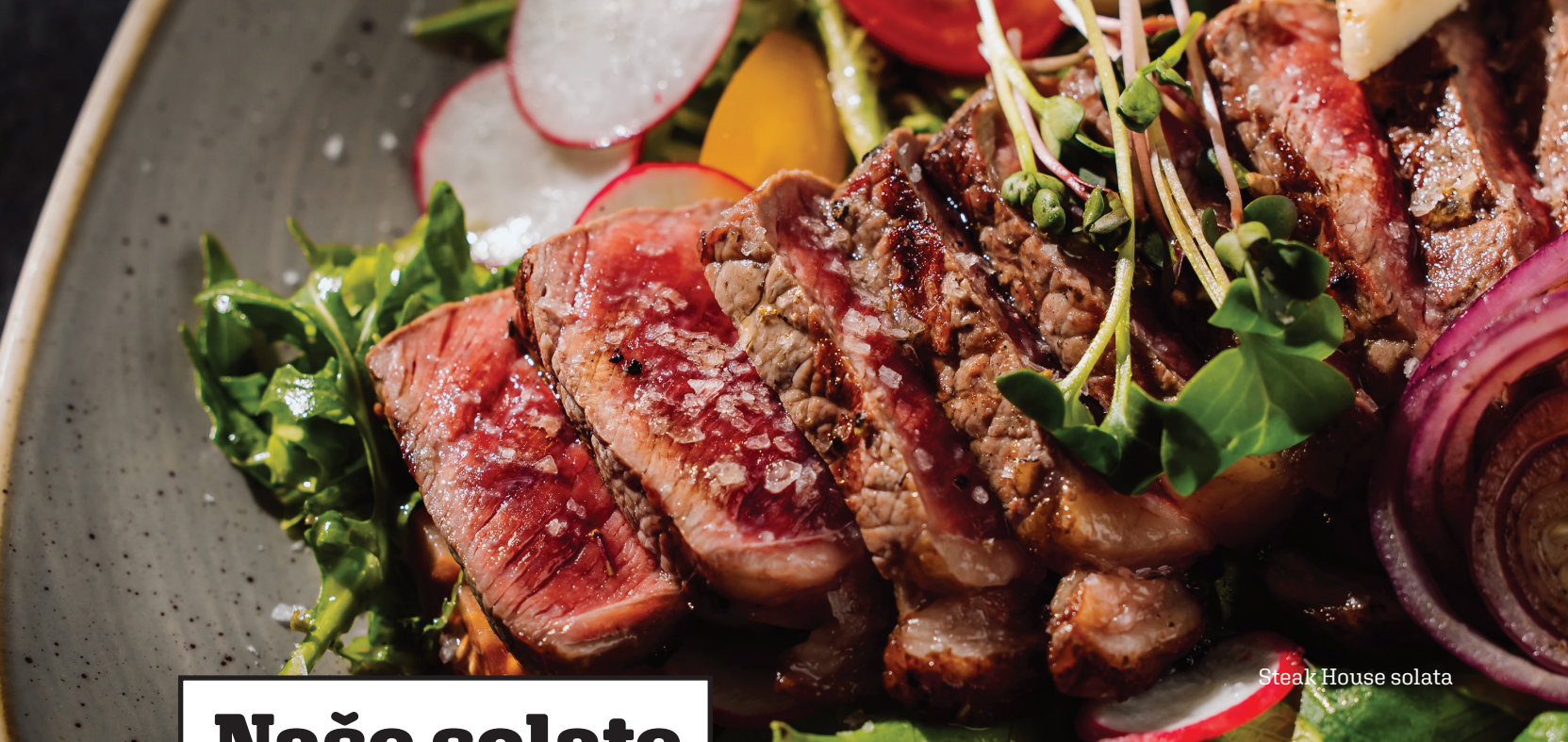
Steak House solata